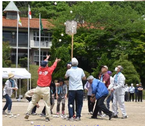
紅白のできはいかが