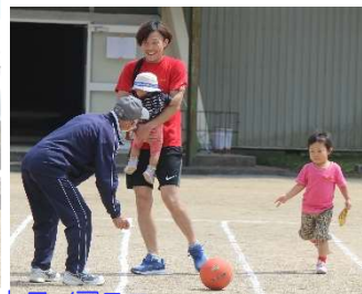
ミントライアスロン