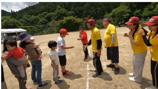
ジャンケン列車(最後の決戦)