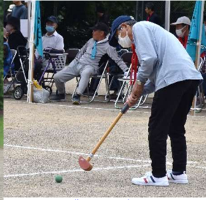
帝釈のゴルフプレーヤー