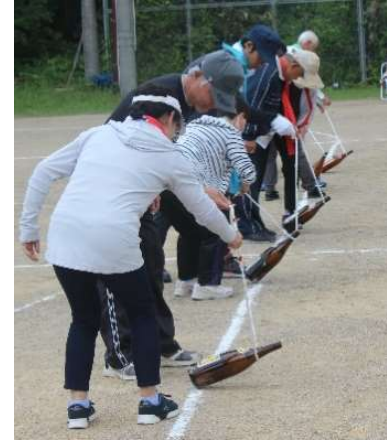
アベックピンおこし