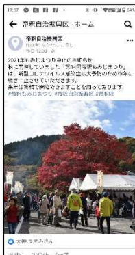
スマートフォン画面