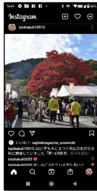
スマートフォン画面