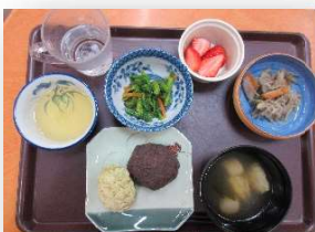
お彼岸は”ぼた餅御膳”