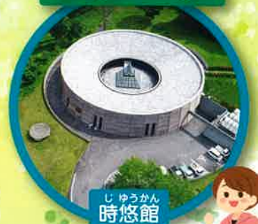
じゆうかん 時悠館