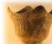
中津式土器 約4千年前

帝釈峡遺跡群の中では最大規模の遺跡です。ここには縄文早期から1万年に渡る13の文化層が存在しそれぞれの層から土器や石器、動物の骨が年代別に見つかっています。まさしく縄文時代の年表となっており我が国の考古学の発展に寄与しました。また人骨が50体以上も見つかると埋葬の習慣があったことなど文化の高さが分かりました。